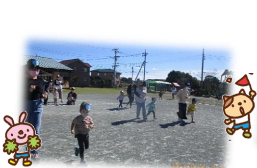
「フレー・フレー ぞうさんチーム」