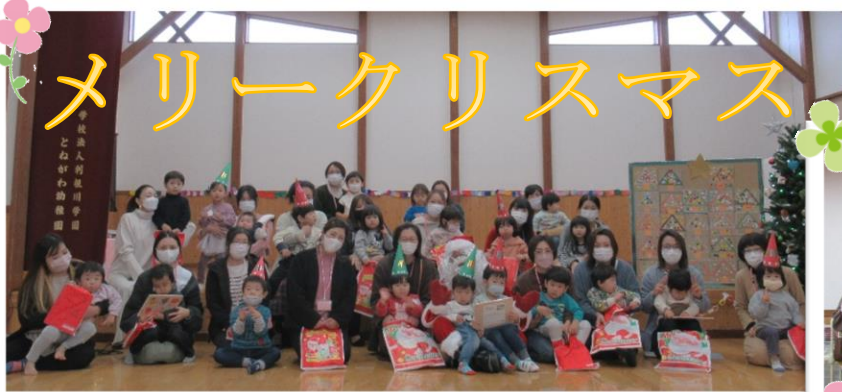
★たのしかったね★ こぐまサークル★