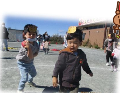
「ぼんぼれ りすさんチーム」