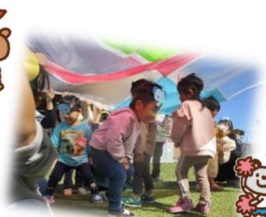
「カラースートの中はきれいだったね」